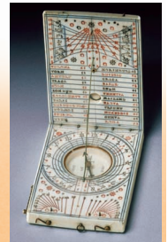
Taschen-Sonnenuhr 1599 DL-Museum München

In der Antike wurde durch Sonnenuhren die wahre Ortszeit bestimmt. Der mit dem Lauf der Sonne wandernde Schatten eines Stabes (Gnomon) zeigt auf einer Skala die Stunden an. Dabei wandert der Schatten immer nach rechts, also in unserem Uhrzeigersinn. Die Zeigeruhr wurde im 14. Jahrhundert erfunden. Die Zeigeruhr bewegt sich ebenfalls nach rechts. Damit wird der Lauf des Schattens nachgebildet.