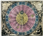
Wahlsystem um 1601 von Kopernikus DL-Museum München