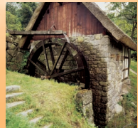
Alte Mühle im Schwarzwald