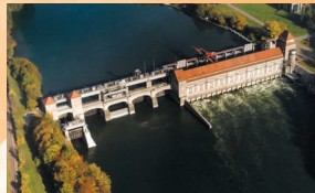
Flusskraftwerk am Rhein